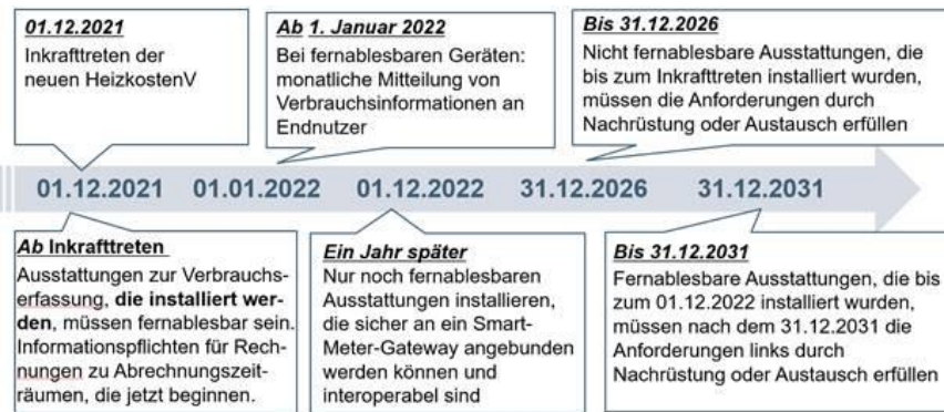
Abbildung 1: Wesentliche Pflichten nach HeizkostenV im Überblick anhand der Zeitskala ihres Inkrafttretens

Die folgende Abbildung zeigt die wesentlichen Pflichten im Überblick anhand der Zeitskala ihres Inkrafttretens.